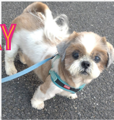
お散歩でも人気者の イケメンわんこ