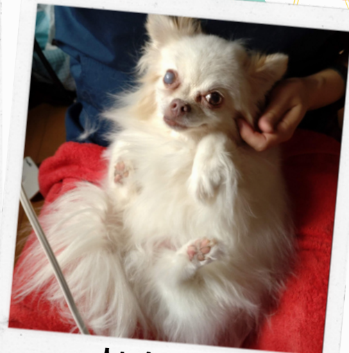
一人になると急に されるがまま...