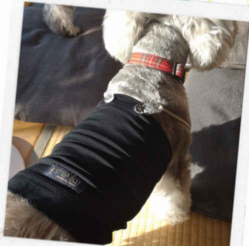
実はすごい効果の首輪と腹巻を セットで誕生日にプレゼント