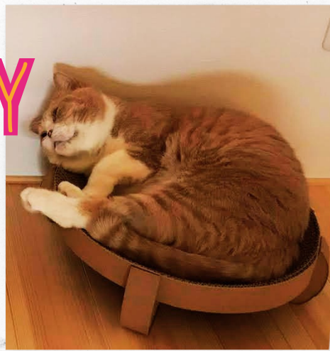
くつろぐ姿に癒されます