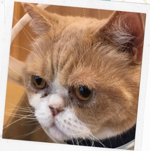
実はまりっとイケメン