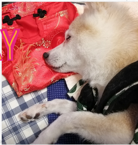
寒さ対策もばっちりです