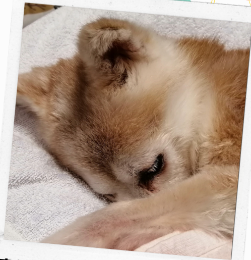
寝顔は天使、起きると元気すぎ...